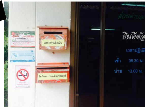
ยื่นผ่านกล่องรับเรื่องร้องเรียน/ร้องทุกข์

ยื่นทางไปรษณีย์ตามที่อยู่ ๑๙๐ ม. ๓ อบต.เมืองพล อ.พล จ.ขอนแก่น ๔๐๑๐๒