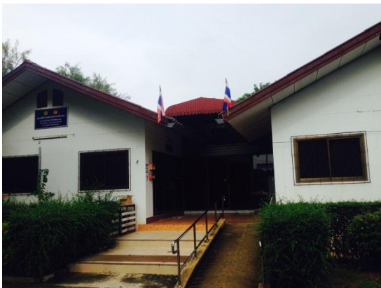
ยื่นโดยตรงที่ สำนักงาน อบต.

ยื่นทางไปรษณีย์ตามที่อยู่ ๑๙๐ ม. ๓ อบต.เมืองพล อ.พล จ.ขอนแก่น ๔๐๑๐๒